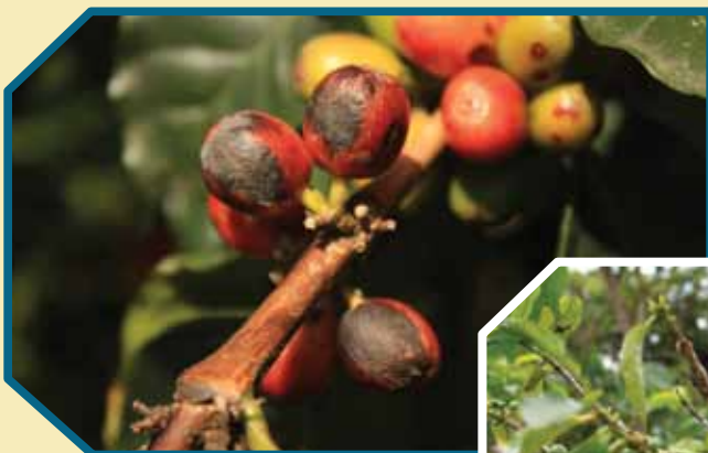
Mancha de hierro

En los frutos sobremaduros y secos que quedan en el árbol y en el suelo después de la cosecha se pueden albergar desde 10 hasta 150 adultos de broca y allí permanecen hasta que las condiciones ambientales le sean favorables para su reproducción (2). La emergencia de adultos de broca se incrementa después de períodos prolongados de déficit hídrico, sin embargo el mayor vuelo de adultos inicia con las primeras lluvias (5). En un estudio en un gradiente altitudinal de 1.200 a 1.700 m en la zona central cafetera, la emergencia de adultos de broca a partir de 20 frutos secos