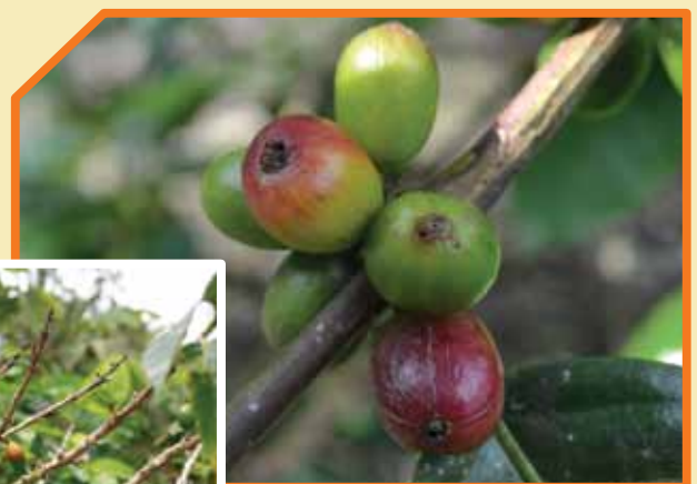
Broca del café