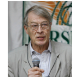
Donald Broom, Biólogo y profesor emérito de Bienestar Animal en la Universidad de Cambridge.