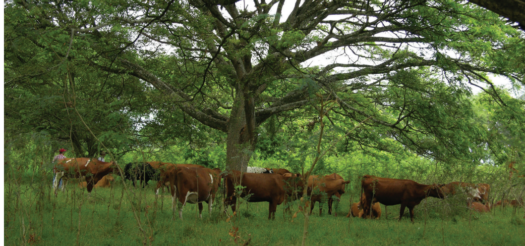
El samán en sistemas silvopastoriles en la Reserva Natural El Hatco. Municipio el Cerrito, Valle del Cauca.

Colombia expondrá ante el mundo ganadero las experiencias de una ganadería tropical sustentable, basada en los Sistemas Silvopastoriles Intensivos implementados hace más de dos décadas en la Reserva Natural el Hatco y el Proyecto Ganadería Sostenible Colombiana liderado por Fedegan.