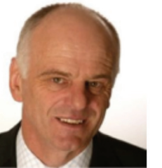
David Nabarro, Coordinador del Equipo de Tareas de Alto Nivel de las Naciones Unidas.

PROGRAMA MUNDIAL DE GANADERÍA SOSTENIBLE